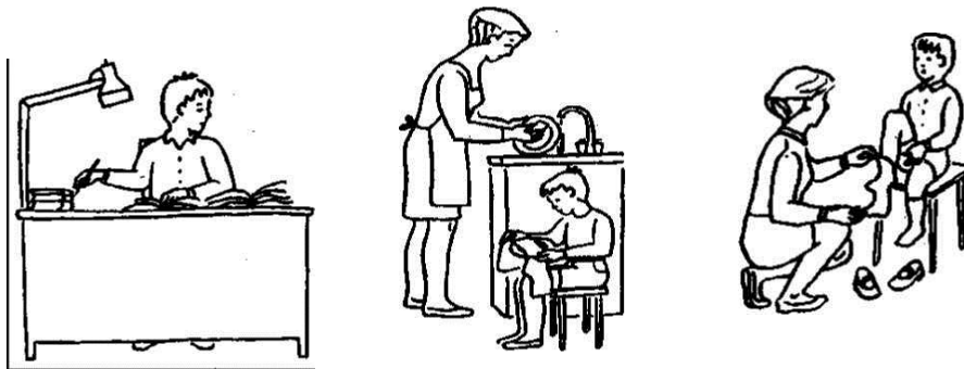
до 5 рр.