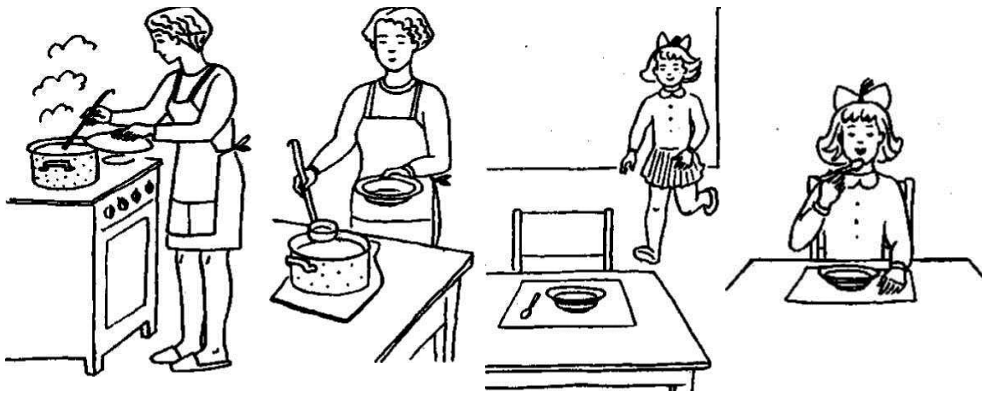
Серія сюжетних картинок до методики «Розкажи за картинкою» для дітей від 4